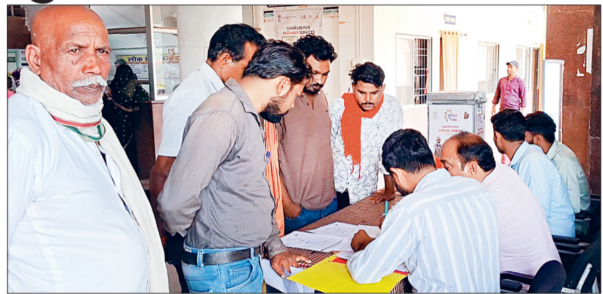
हरिभूमि न्यूज ►► बेमेतरा

जिले में सुशासन तिहार 2025 के अंतर्गत "आवेदन लेने समाधान पेटी" में डालने का प्राप्त करने का सिलसिला " महावीर जयंती के अवकाश के दिन भी चला। यह अभियान कल 11 अप्रैल 2025 तक चलेगा, जिसमें आम जनता से उनकी समस्याएं, मांग और शिकायतों के आवेदन आ रहे हैं। जिला प्रशासन द्वारा यह प्रक्रिया सुबह 10 बजे से शाम 5 बजे तक जिले के ग्राम पंचायत मुख्यालयों, नगरीय निकाय कार्यालयों, हाट-बाजारों एवं कॉमन सर्विस सेंटरों में संचालित की जा रही है। प्रत्येक स्थल पर समाधान पेटियाँ लगाई गई हैं, जिसमें हर वर्ग की महिला और पुरुषों अपनी समस्याएं लिखकर बिना किसी झिझक के डाल रहे हैं। इस पहल के पीछे उद्देश्य है कि शासन और प्रशासन तक सीधे तौर पर जनता की आवाज पहुंचे और उन्हें त्वरित समाधान मिल सके। जिला