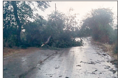
ताकुरटोला में तेज गर्जना के बारिश हुआ। आंधी से सड़क किनारे के कई वृक्ष धाराशाही हो गया जिससे आवागमन कुछ देर बाधित रहा।